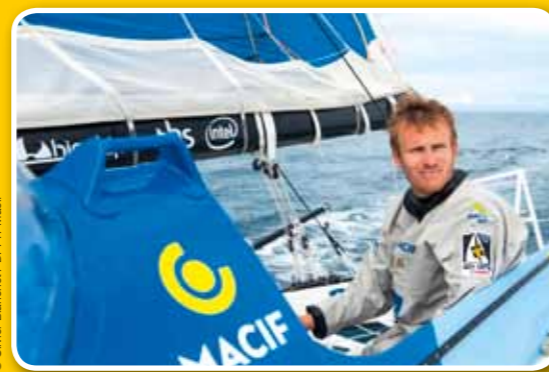
Vainqueur de la Route du Rhum 2014

Ce Pantalon a été plébiscité par plusieurs coureurs équipés « Guy Cotten ». Ils apprécient le renfort genoux qui descend jusqu'au bas de la jambe. Harnais à la ceinture. Existe en Marine et Rouge.