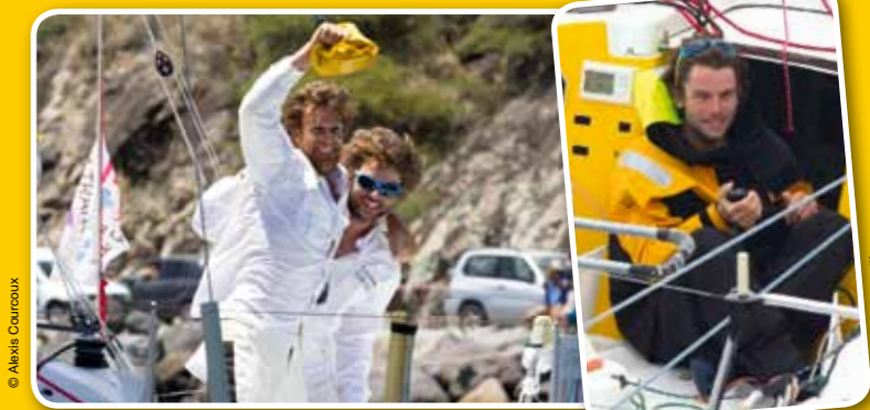
Vainqueurs AG2R 2014