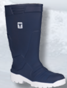
Confort remarquable des Bottes GC Ultralite. Légères et souples.