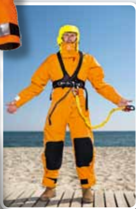
François Gabart s'équipe de l'Ultima pour toutes ses navigations sur les bateaux Macif.