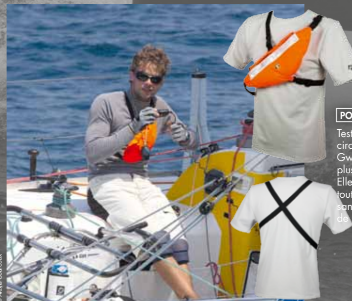
POCHETTE SÉCU FLUO

Une poche sur la cuisse. Le renfort genoux descend jusqu'en bas de la jambe. Larges renforts fessiers.